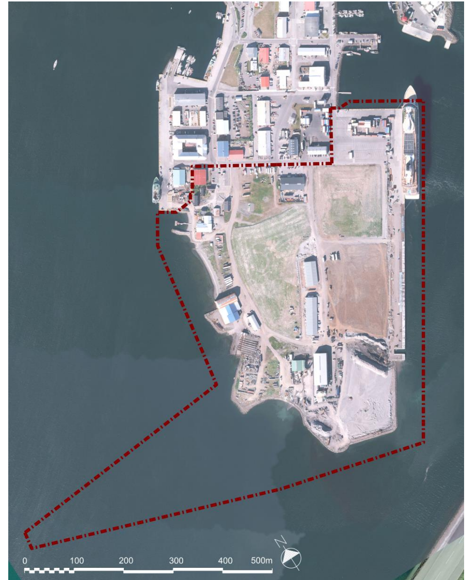
Mynd 1 Afmörkun svæðis sem aðalskipulagsbreytingin tekur til.

Skipulagsbreytingin felur ekki í sér framkvæmdir sem eru tilkynningarskyldar eða matsskyldar skv. lögum um umhverfismat framkvæmda og áætlana nr. 111/2021. Fjallað er um umhverfismat aðalskipulagsins í kafla 4.