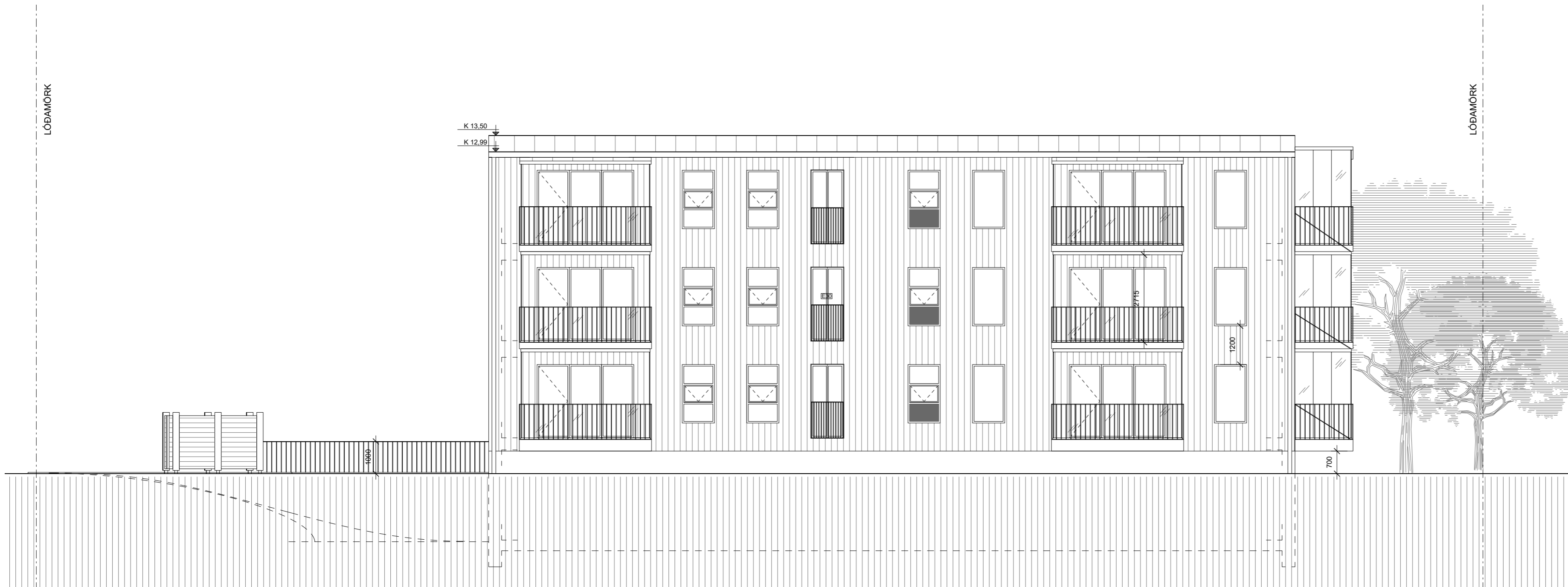
ÚLIT NORD-VESTUR 1:100