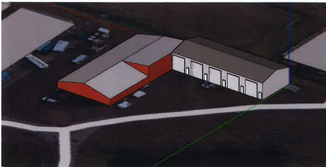
Mynd 2, útlitsmynd, rautt nús er núverandi hús, grátt viðbygging sem sótt er um