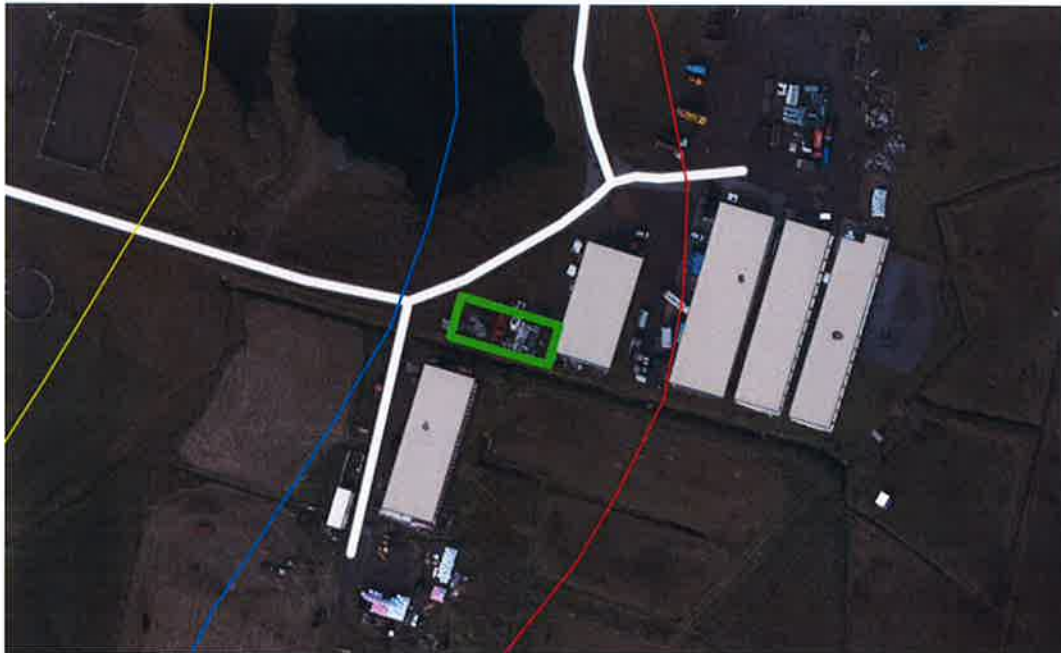
Mynd 1, afstöðumynd með hættumatslínum

Undirritaður fyrir hönd Aðstaðan sf. Kt. 511285-0549 óska eftir álitum á því hvort heimilt sé að byggja við húsið að Kirkjubólslandi L138012 skv. neðan greindum myndum.