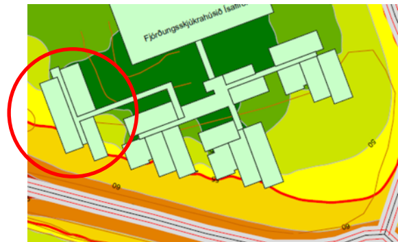
Mynd 6: Tillaga VA arkitekta að hluta utan við hljóðmörk.