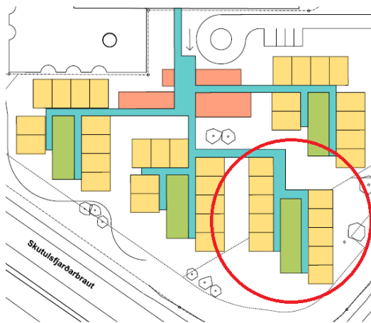
Mynd 2: Tillaga VA arkitekta innan við hljóðmörk.