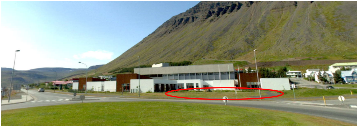
Mynd 1: Götusýn að lóðarvalkosti.

Hjúkrunarheimili, 10 rými, staðsett á lóð við núverandi hjúkrunarheimili við hringtorg (Skutulsfjarðarbraut)