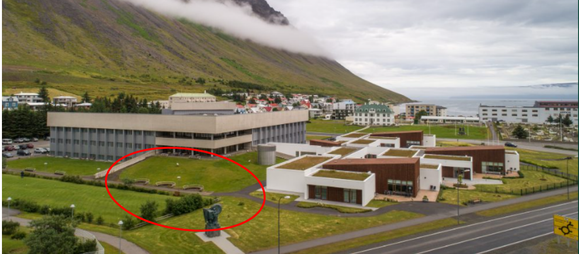
Mynd 4: Götusýn að lóðarvalkosti.

Hjúkrunarheimili, 10 rými, staðsett á lóð suðvestan við sjúkrahús og vestan við núverandi hjúkrunarheimilis Eyris á Ísafirði.