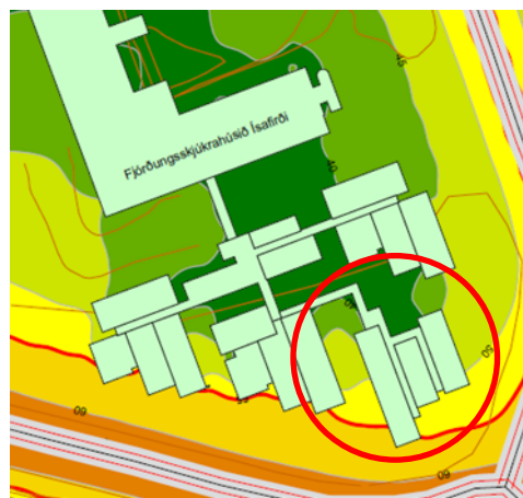
Mynd 3: Tillaga VA arkitekta að hluta utan við hljóðmörk.