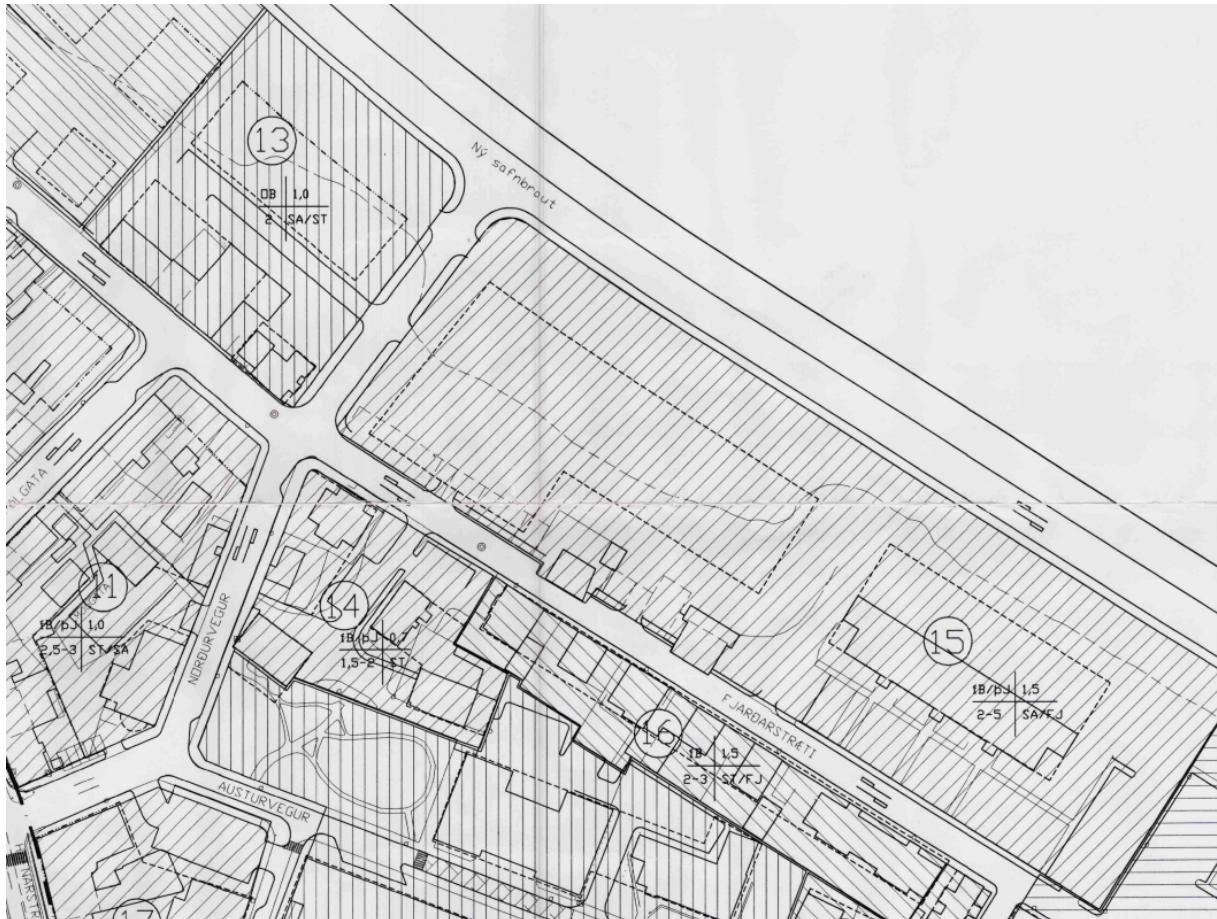
Úrklippa af skipulagsuppdrætti frá 1997

Samkvæmt samþykktri óverulegri breytingu á deiliskipulagi fyrir reit 15 er stærð lóðar 2.270 m 2 .