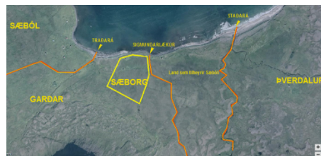
Mynd 1 Yfirlitsmynd Sæból, Sæborg, Garðar