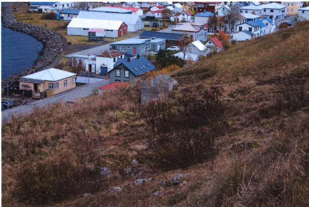
Umræddur skúr fyrir miðju á myndinni.