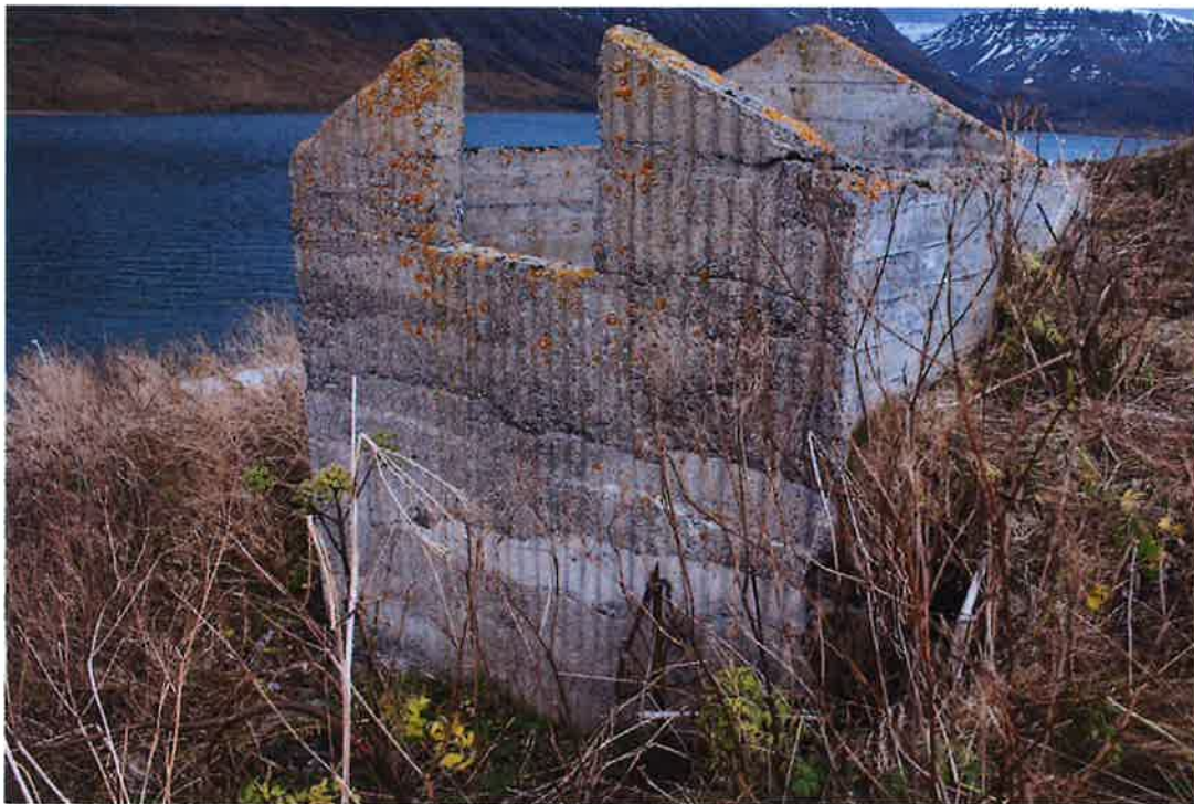
Skúrinn ljósmyndaður til norðuts.