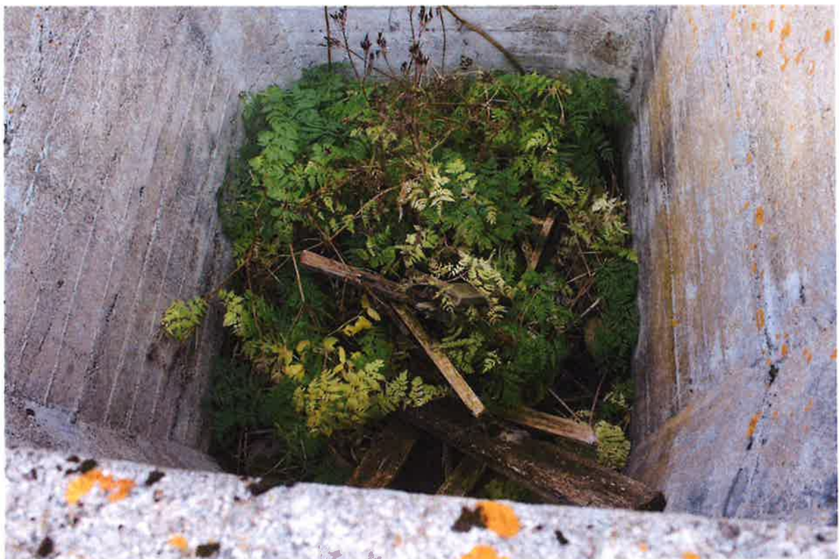
Mynd tekin ofan í gryfjuna.