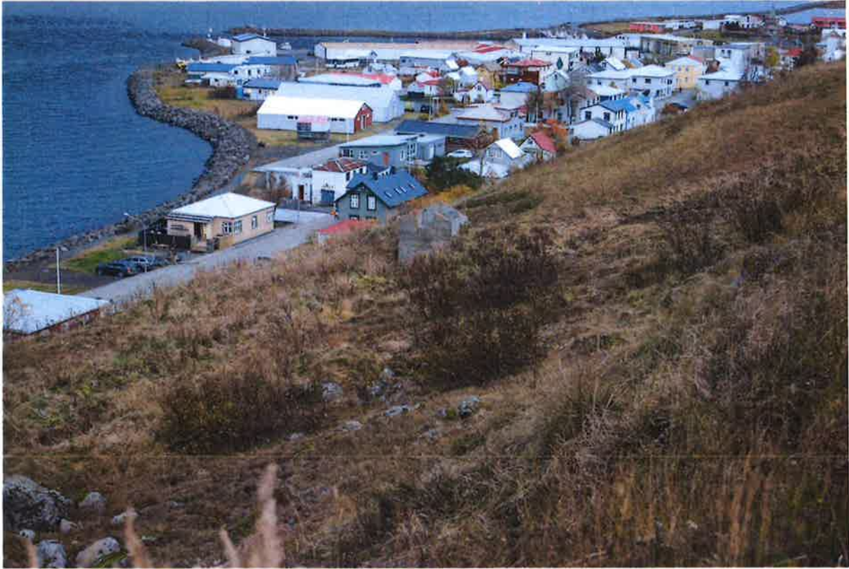
Hér má sjá skúrinn fyrir miðju á myndinni.