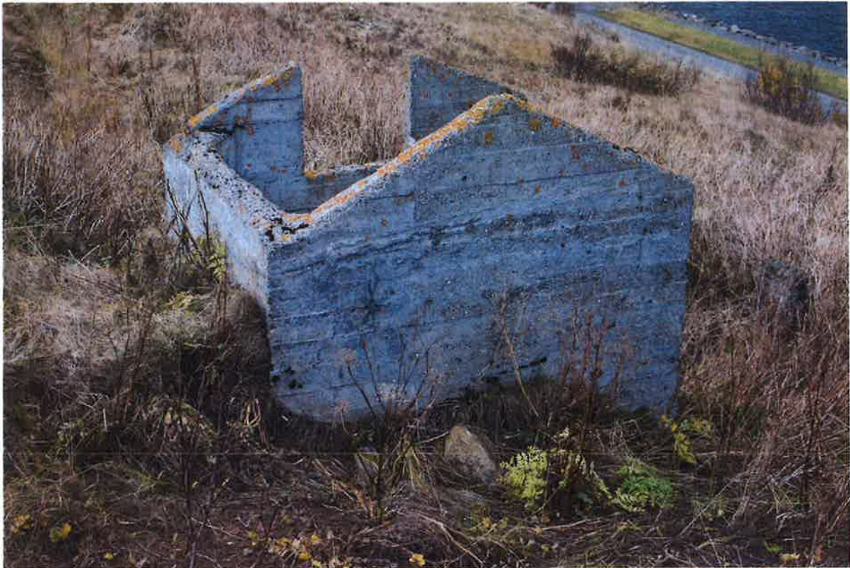
Skúrinn ljósmyndaður frá austri.