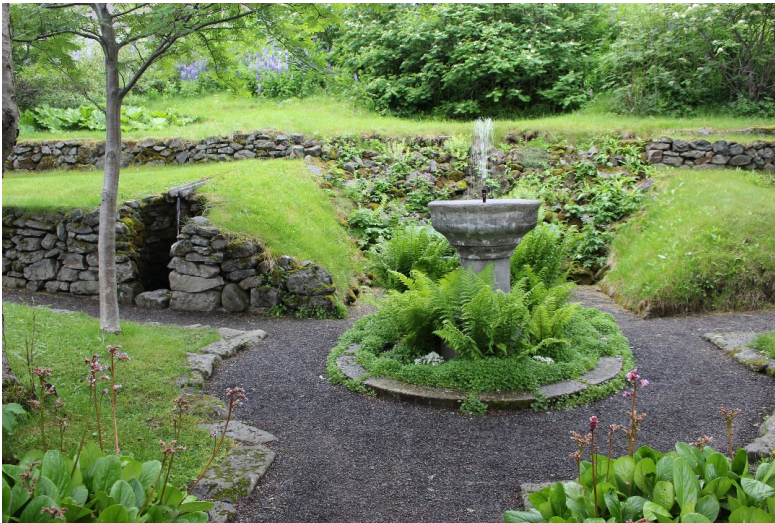
Mynd 3. Gosbrunnur og umhverfi í Skrúði.

Athugasemd [ÁH2]: Viðbót þegar friðlýsing hefur verið staðfest.