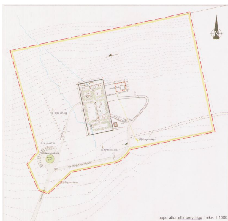
Mynd 5. Úr deiliskipulagi eftir breytingar 2017.

Tekið er fram í markmiðum aðalskipulagsins að eitt þeirra sé að vernda og viðhalda skrúðgörðum (bls. 152). Auk þess segir: „Eldri skrúðgarðar skulu njóta verndar og áhersla lögð á endurnýjun úr sér genginna hluta þeirra. Skrúðgarðar eru lifandi og þurfa því stöðugt viðhald og endurnýjun til að viðhalda upphaflegum markmiðum“. Því er ljóst að Skrúði er, í þeim skipulagsáætlunum sem í gildi eru, ætlað að halda áfram að vera skrúðgarður með opið aðgengi þar sem hugað er að verndun og viðhaldi staðarins.