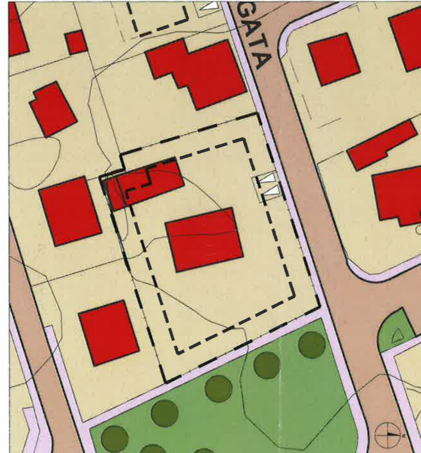
Tillaga að breytingu 1:500