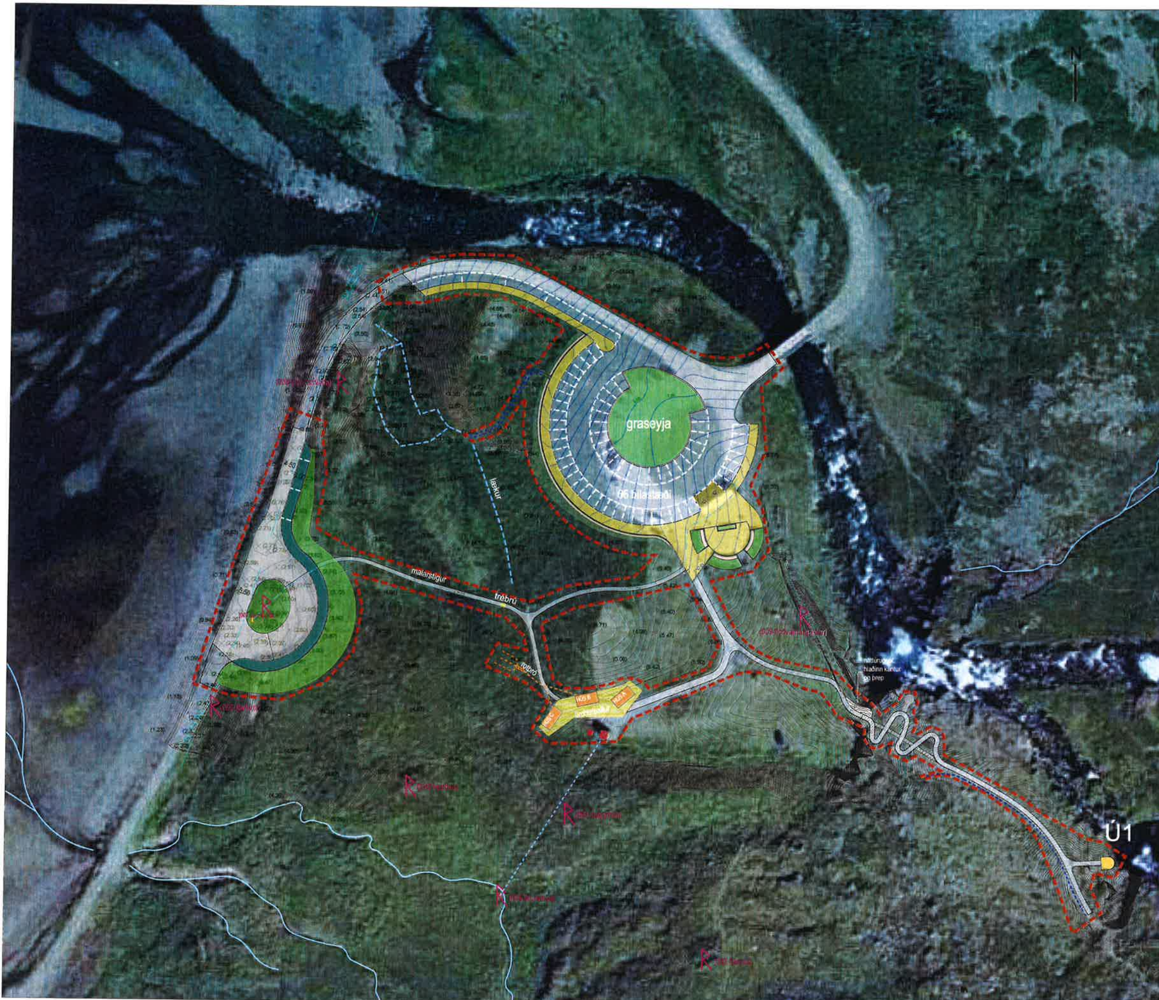
Yfirlitsmynd - mkv. 1:750