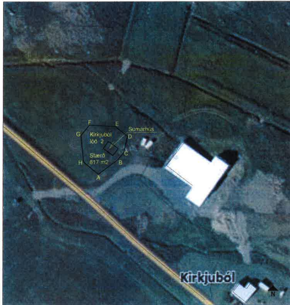
Afstöðumynd. Kirkjuból Lóð 2 Mkv: 1/1000