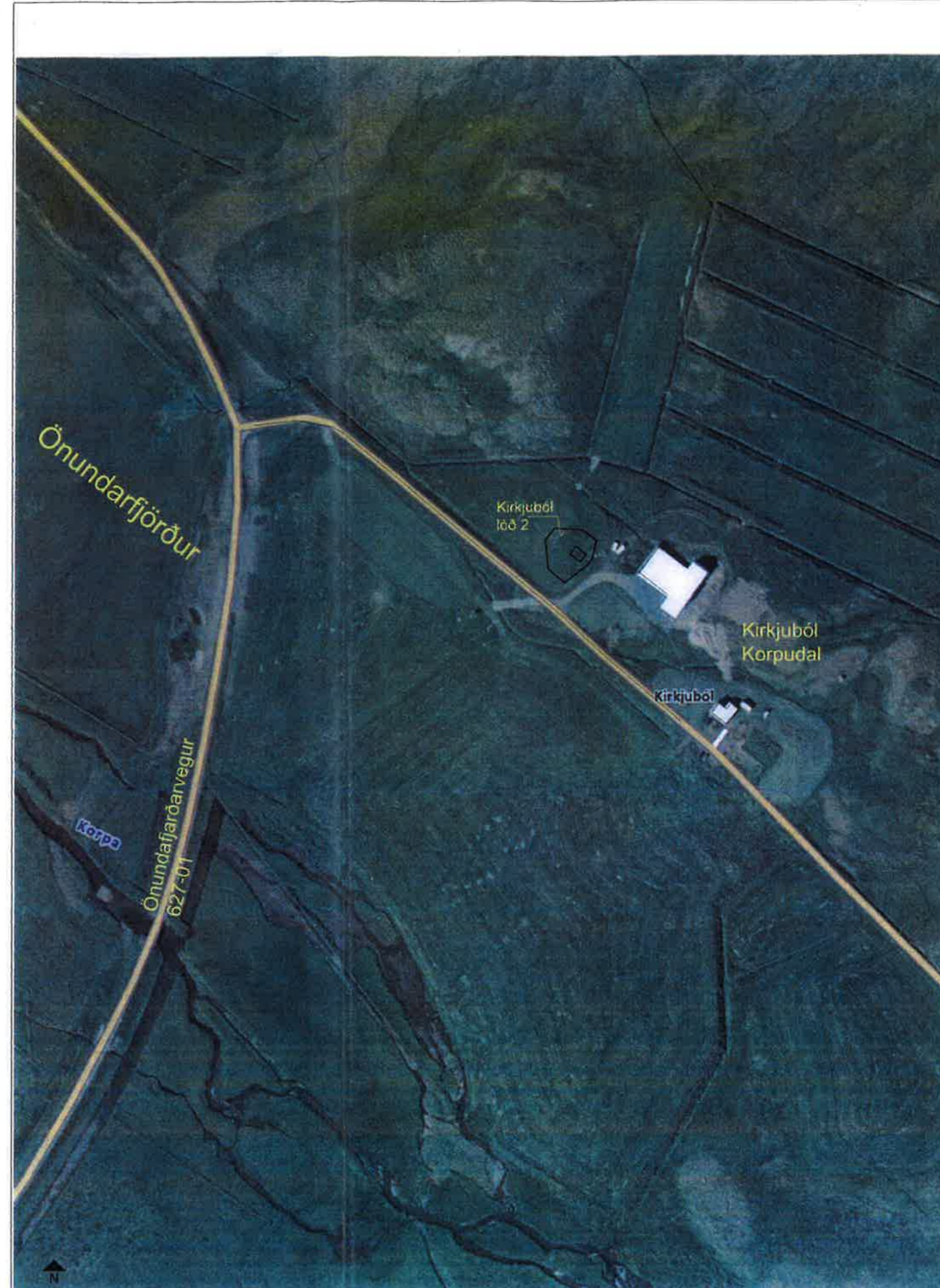
Afstöðumynd. Mkv 1/2000