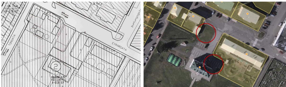
Mynd 3 Til vinstri er hluti uppdráttar gildandi deiliskipulags fyrir Eyrina á Ísafirði frá 1997. Til hægri er skjáskot af vefsíðu Landeignaskrár HMS sem sýnir þinglýst lóðarmörk. Rauðum hringjum hefur verið bætt inn á myndina en þeir sýna mögulega staðsetningu skólastofunnar.