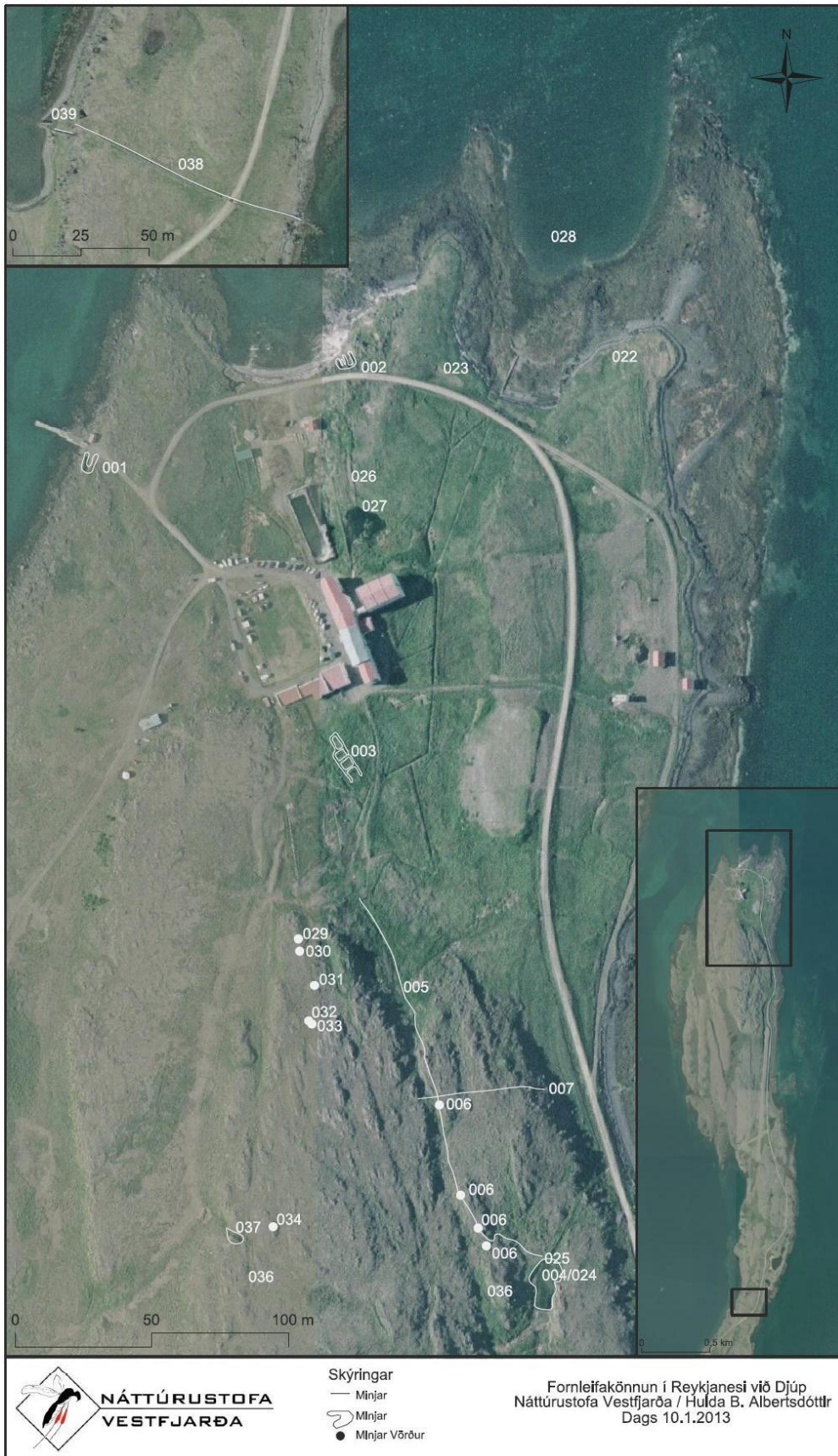
Mynd 1-7 Fornleifakönnun í Reykjanesi. (Náttúrustofa Vestfirðra).