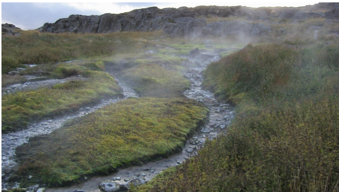
Mynd 1-5 Vatnamynta við Kolahver, að hausti.

Í Reykjanesi er einn af þremur fundarstöðum vatnamyntu (lat. Mentha aquatica ) á landinu. Vatnamynta er alfriðuð en hún er afar sjaldgæf og finnst eingöngu við laugar. 14