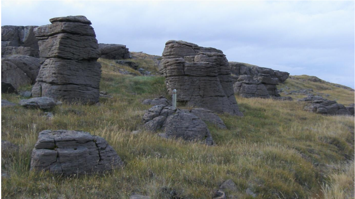
Mynd 1-2 Sérstæðir klettur á austanverðu Reykjanesi.