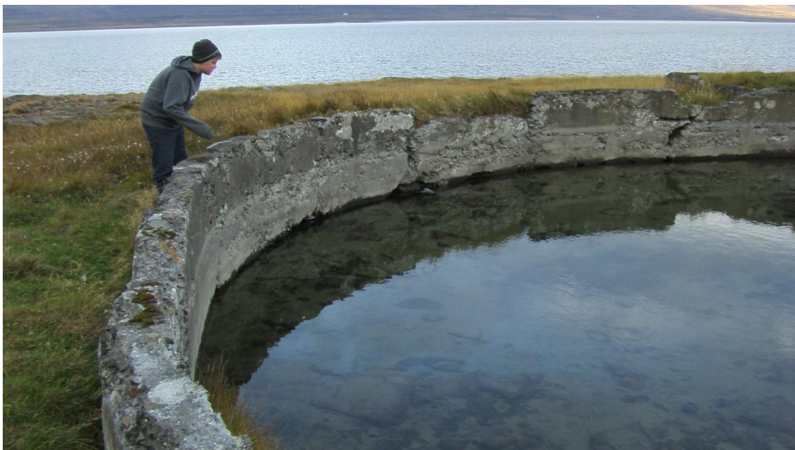
Mynd 1-6 Gamla sundlaugin var byggð árið 1889.

Við færslu þjóðvegarins, frá austanverðu nesinu yfir á það vestanvert, jukust útivistarmöguleikar á því svæði sem hefur hvað fjölskrúðugasta náttúru. Gamli vegurinn getur nýst sem reið- og gönguleið og til fugla- og selaskoðunar. 17