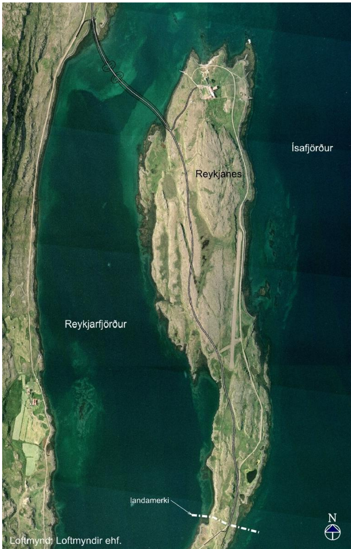
Mynd 1-1 Loftmynd af Reykjanesi. Landamerkin sjást neðst á myndinni.