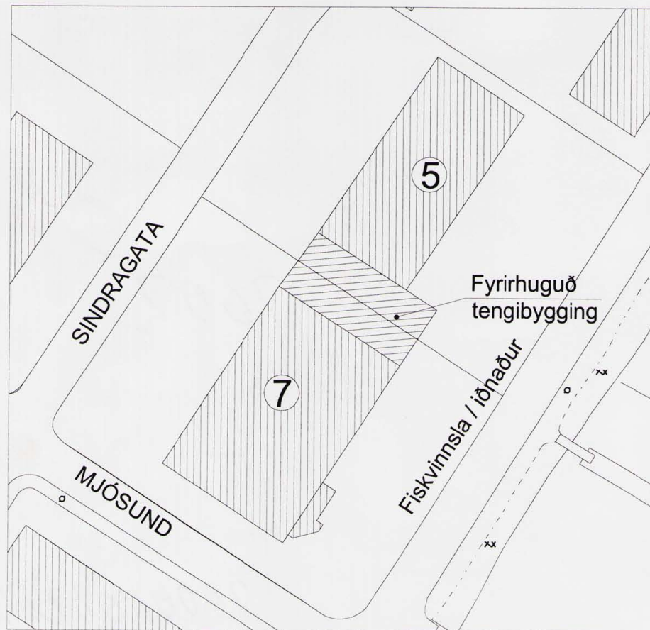
Tillaga að breytingu. Mkv. 1/1000 (A3). Sept. 2006