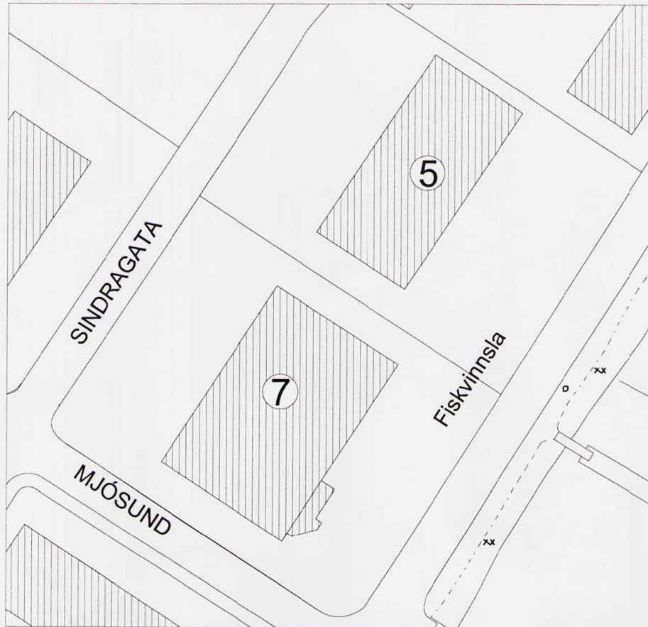
Gildandi skipulag. Mkv. 1/1000 (A3). Samþykkt 27.sept 1995