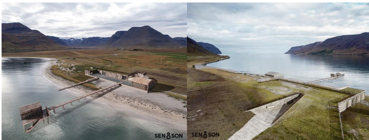
MYND 1. Hugmyndir um uppbyggingu baðastaðarins.