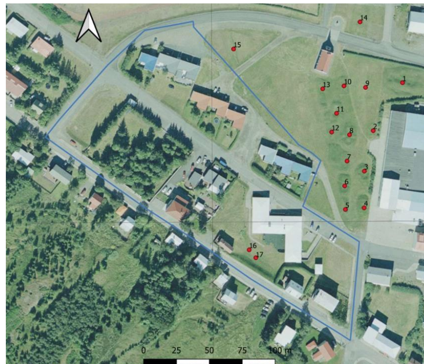
Mynd 2 Skráðir minjastaðir í og við deiliskiplagssvæðið.

Ekki sést til þessara fornleifa og hætta telst engin skv. fornleifaskráningu.