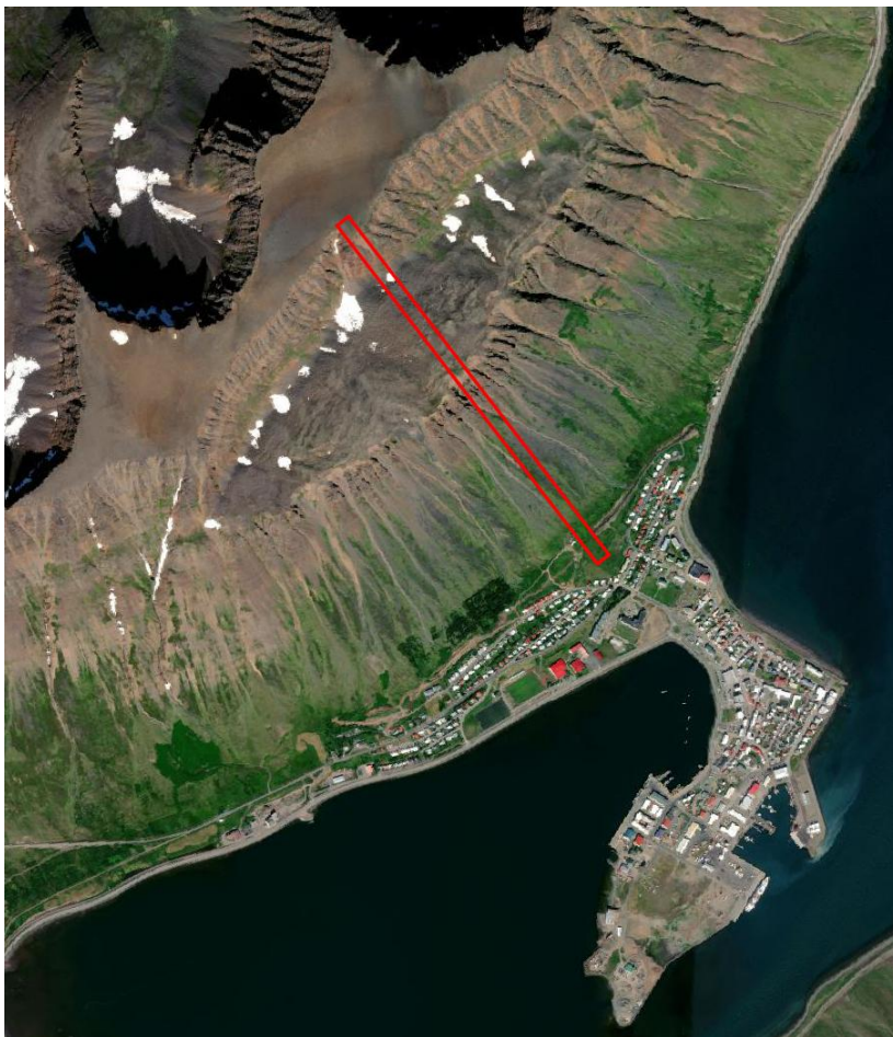
MYND 2 Staðsetning kláfs á Eyrarfjalli 2

Búið er að byggja upp snjóflóðavarnargarða neðst í hlíðum Eyrarfjalls, neðan Gleiðarhjalla, til að verja byggð á snjóflóðahættusvæði C. Upphafsstöð er innan snjóflóðahættusvæðis B, sjá nánar í kafla 2.3.