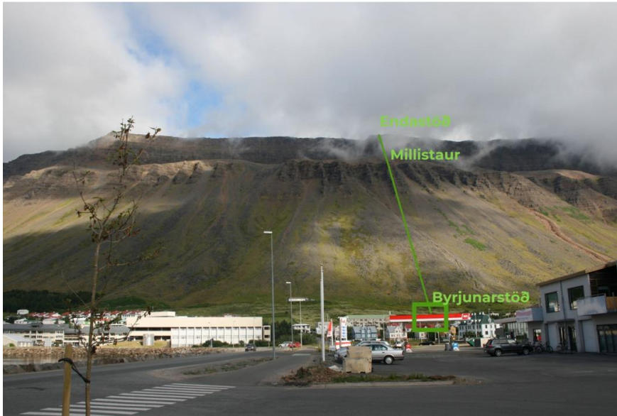
MYND 1 Staðsetning kláfs 1 .

Sett er fram tillaga að breytingu á Aðalskipulagi Ísafjarðarbæjar skv. 1. mgr. 36. gr. skipulagslaga nr. 123/2010, ásamt umhverfisskýrslu skv. lögum um umhverfismat framkvæmda og áætlana nr. 111/2021. Breytingin felur í sér að skilgreina nýjan landnotkunarreit fyrir afþreyingar- og ferðamannasvæði (AF1) í og við rætur Eyrarfjalls í stað óbyggðra og opinna svæða, þar sem Eyrarkláfur ehf. áformar að reisa kláf ásamt tilheyrandi mannvirkjum. Unnið verður deiliskipulag fyrir framkvæmdina samhliða aðalskipulagsbreytingunni.