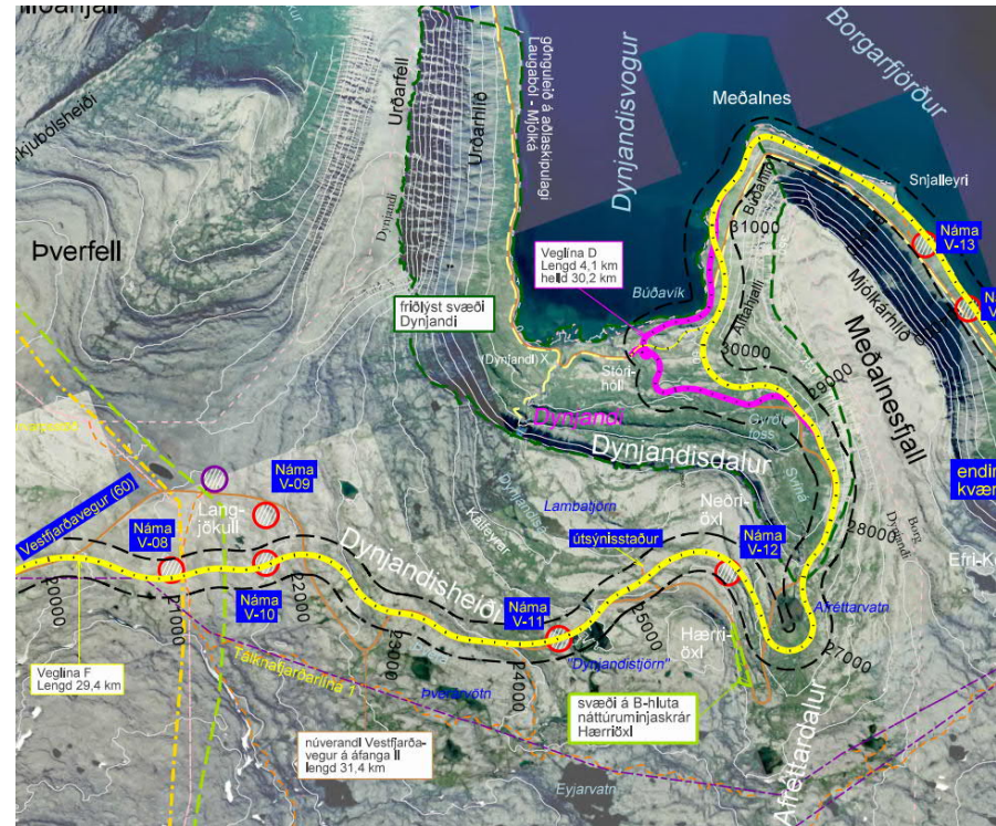
Mynd 2 Myndin sýnir tvo kosti sem verða skoðaðir og eru það svokallaðar D og F leiðir upp úr Dynjandisvogi.

Stefnukostir eru þeir valkostir sem ákveðið er að taka afstöðu til í umhverfismati áætlunar. Þeir eru þannig bornir saman í umhverfismatinu m.t.t. áhrifa þeirra á umhverfið og mat lagt á hvaða valkostur hefur minnstu óæskilegu áhrifin á umhverfið en stuðlar best að jafnvægi milli hinna þriggja stöða sjálfbærrar þróunar sem eru umhverfi, samfélag og efnahagur.