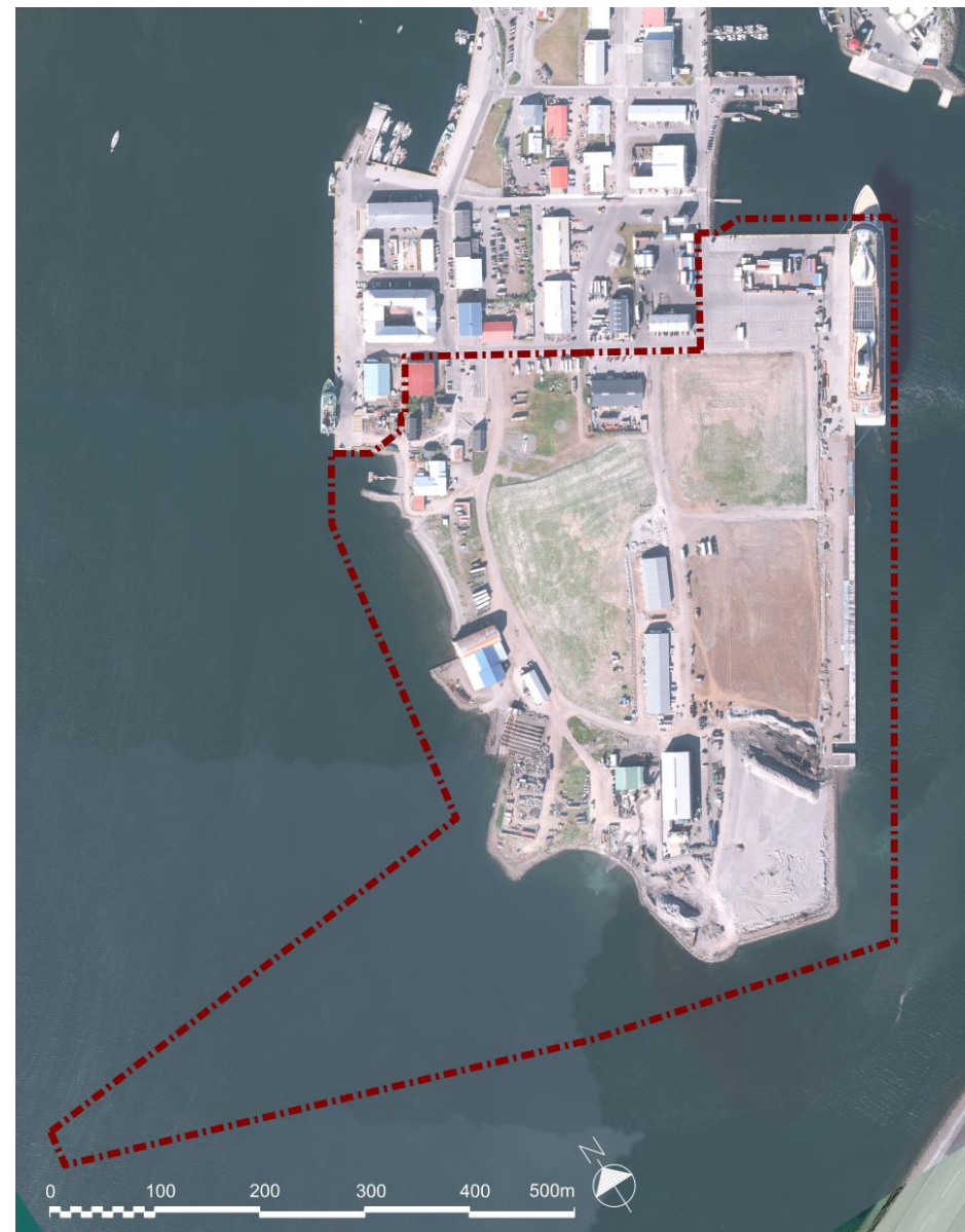
Mynd 1 Afmörkun svæðis sem aðalskipulagsbreytingin tekur til.

Skipulagsbreytingin felur ekki í sér framkvæmdir sem eru tilkynningarskyldar eða matsskyldar skv. lögum um umhverfismat framkvæmda og áætlana nr. 111/2021. Fjallað er um umhverfismat aðalskipulagsins í kafla 4.