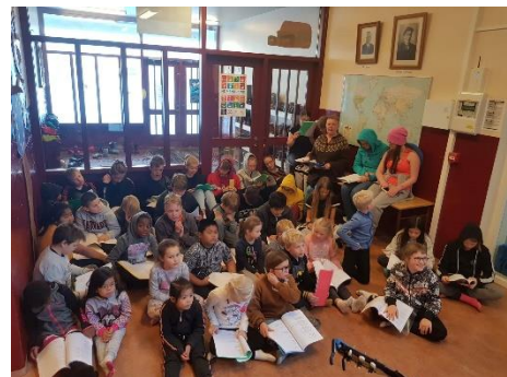
Frá söngstund í október

Haldin voru tvö nemendaþing þar sem allir nemendur skólans ræddu með skipulögðum hætti annars vegar um samskipti í frímínútum og matsal og hvernig væri best að hafa fyrirkomulag þannig að allir geti verið öruggir og sáttir og hins vegar um einelti og hvað starfsfólk,