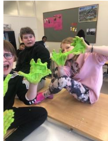
Tilraunatími í samfélagsfræði

Í lífsleikni var lögð áhersla á lýðræðisleg vinnubrögð, samtal bekkjarfélaga, samvinnuverkefni og umræður um vinsamlega hegðun og samskipti. Farið var ofan í saumana í Barnasáttmála Sameinuðu þjóðanna og bæklinginn Réttindi mín . Haldnir voru bekkjarfundir eftir þörfum. Haldið var eitt bekkjakvöld fyrir áramót þar sem farið var í ýmsa leiki, spilað, dansað og