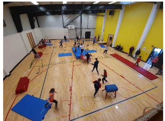
Tarsanleikur skipulagður af nemendum elsta stigs

Í íþróttum var lögð áhersla á einstaklingsbundna þol og styrktarþjálfun, hópleiki og hótæfli, samskipti og verkefni sem miðuðu að því að auka sjálfstæði nemenda. Unnin voru lýðræðisleg verkefni sem höfðu það að markmiði að auka metnað og áhuga nemenda.