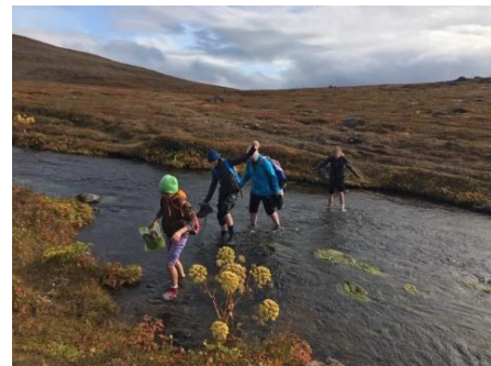
Áskoranir geta verið af mörgum toga, sumir nemendur höfðu aldrei vaðið vfir á.

Yngsta stig fór í heimsókn til Súðavíkur en þar var farið að skoða Melrakkasetrið. Einnig var kíkt í heimsókn í Sætt og Salt ásamt elstu nemendum leikskólans.