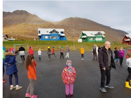
Frá öðruvísleikunum í Súðavík

6. og 7. bekkur fóru í skólabúðirnar að Reykjum ásamt nemendum frá öðrum stöðum á norðanverðum Vestfjörðum. Að þessu sinni voru það 7 strákar sem fóru með umsjónarkennaranum sínum og voru bæði nemendur og kennari alsælir með ferðina.