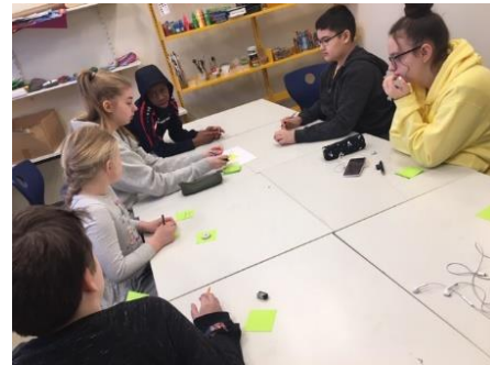
Hluti af lýðræðisvinnu skólans felst í að halda regluleg nemendafing þar sem nemendur ræða með skipulögðum hætti um tiltekin málefni.