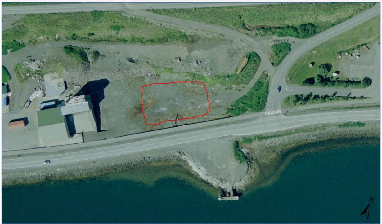
Hjólagarður á Grænagarði