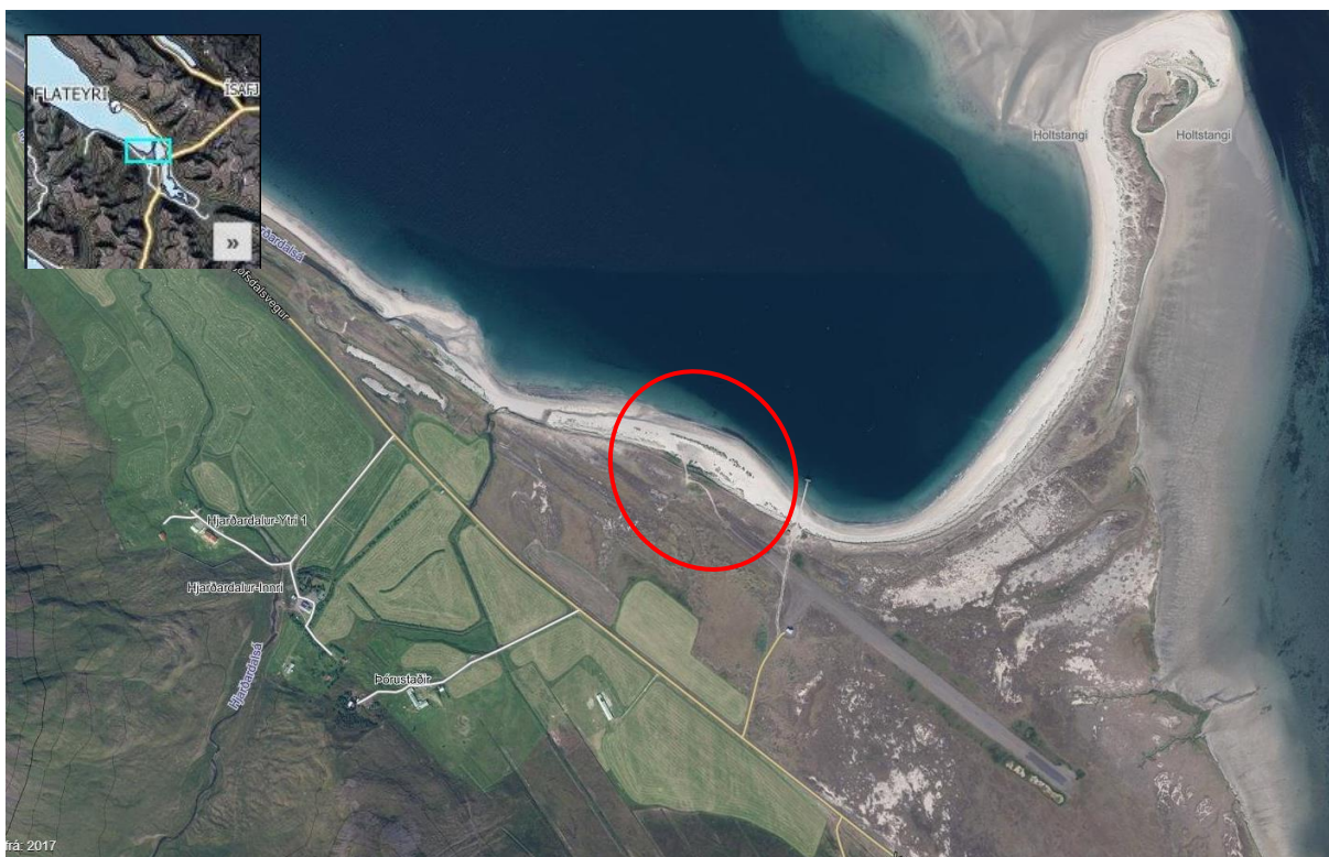
MYND 1. Gróf afmörkun á svæði þar sem unnið verður nýtt deiliskipulag og breyting á aðalskipulagi vegna baðstaðar í Holtsfjöru í landi Þórustaða.

Unnið er að undirbúningi baðstaðar í Holtsfjöru í landi Þórustaða. Í dag er Holtsfjara vinsæl til útivistar en þar eru hvítir sandar í stórbrotnu umhverfi. Áætlað er að nýta núverandi aðkomuveg að Holtsbryggju sem aðkomu að baðstaðnum og nýta gömlu malbikuðu flugbrautina fyrir aðkomu og bílastæði. Núverandi vegaslóði frá flugbrautarenda niður í gamla sandnámu í Holtsfjöru verði nýttur sem aðkoma gesta frá bílastæðinu að böðunum. Sjálf böðin eru áformuð í gamalli sandnámu sem þarna er í fjörunni. Undirbúningur hefur miðað við að mannvirki vegna baðanna verði að mestu leyti bundin við svæði sem nú þegar hefur verið raskað vegna flugvallarins og námunnar. Þá er áfram miðað við að almenningur hafi aðgang að fjörunni og þar verði opin sturtuaðstaða fyrir öll sem vilja baða sig í sjónum, hér eftir sem áður, án þess að fara í böðin. Fyrir baðstaðinn þarf að vinna deiliskipulag og breyta þarf aðalskipulagi Ísafjarðarbæjar með því að breyta landnotkun úr landbúnaðarsvæði/óbyggt svæði í svæði fyrir verslun og þjónustu.