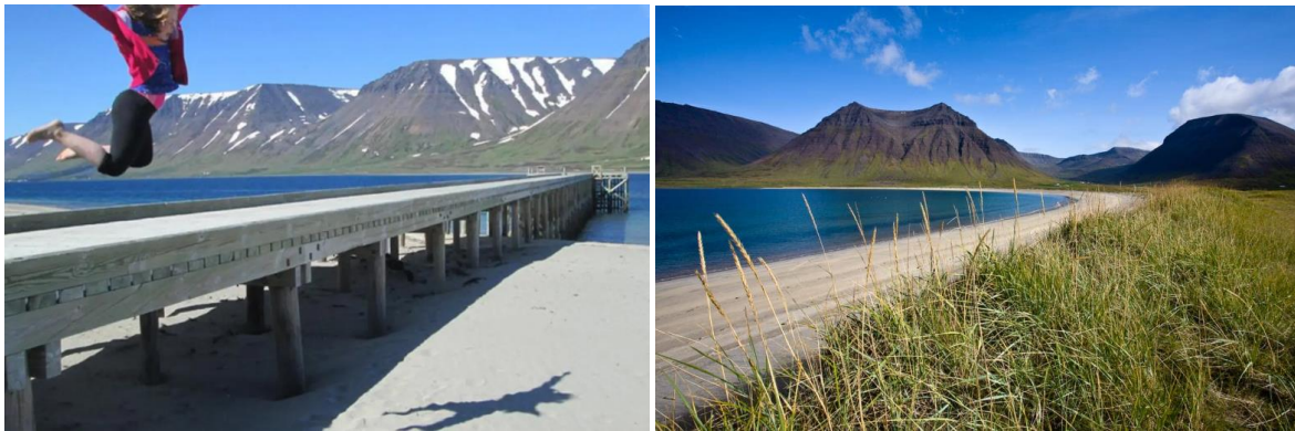
MYND 3. Myndir frá Holtsbryggju og nágrenni af vefnum westfjords.is

Holtsfjara í Önundarfirði er ein af stærri hvítasandsfjörum á Íslandi. Hún teygir sig frá innanverðum Önundarfirði út á Holtsodda sem er mikið sandnes innst í firðinum. Í Holtsfjöru er Holtsbryggja og þar hefur lengi verið vinsælt að stunda sjóböð og byggja sandkastala. Holtsbryggja og nágrenni hennar er mjög vinsælt myndefni hjá ferðalöngum. Við bryggjuna er bárujárnsklæddur skúr og malarplan sem er nýtt sem bílastæði. Bryggjan gegnir öryggishlutverki fyrir samgöngur til Flateyrar og er notuð þegar vegurinn þangað er lokaður vegna snjóflóða eða snjóflóðahættu.