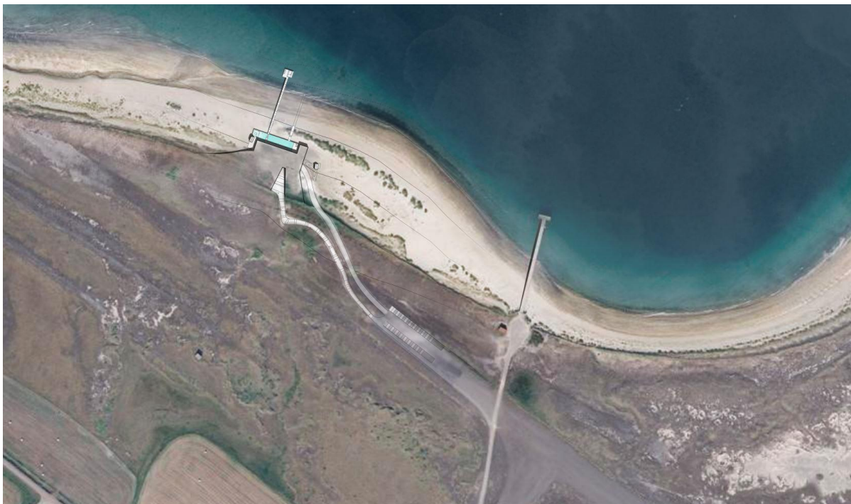
MYND 2 Frumdrög hönnunar til vinstri á myndinni – til frekari útfærslu. Holtsbryggja til hægri.