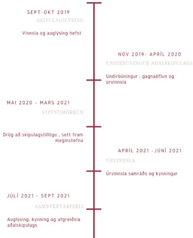
Mynd 5: Tímaferli og áfangar

Stefnt er að kynningu í lok sumars 2021, en tímaferli er rakið í skýringamynd hér að neðan.