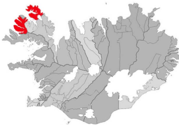
Mynd 1: Ísafjarðarbær

Sveitarfélagið er 2.397,3 km 2 að flatarmáli og íbúafjöldi var 3.800, 1.janúar 2019.