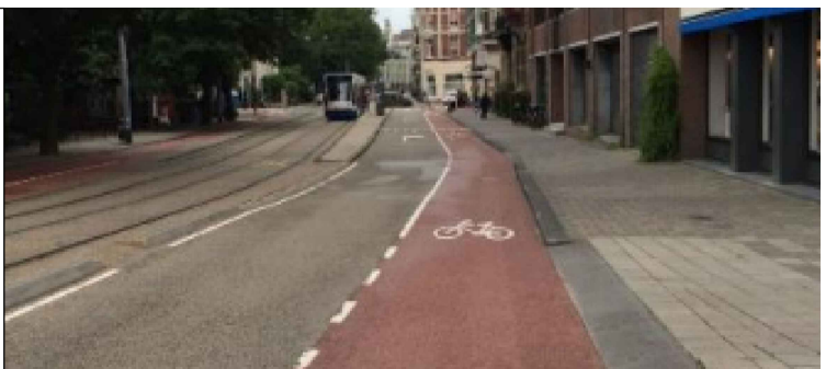
DÆMI UM HJÓLREIÐASTÍG

HÖNNUN Bílastæði staðsett norðanmegin í götunni. Dvalarstaðir sunnan megin götunnar með undantekningu við Edinborgarhúsið. Aðalgatan er einstefnugata frá Silfurtorgi að enda Edinborgarhús þar sem hún breytist í tvístefnuakstursgötu. Tvístefnu reiðhjólagata staðsett sunnan megin frá Silfurtorgi að Mjósundi. Bætt aðgengi fyrir gangandi með niðurtekt á gangstéttum og leiðilinum. Bílastæði staðsett norðan megin götunnar sem langstæði