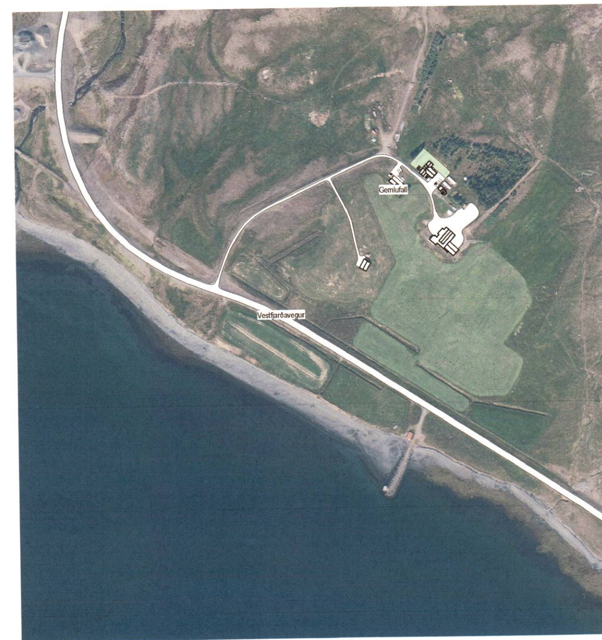
2 Afstöðumynd 1:5000