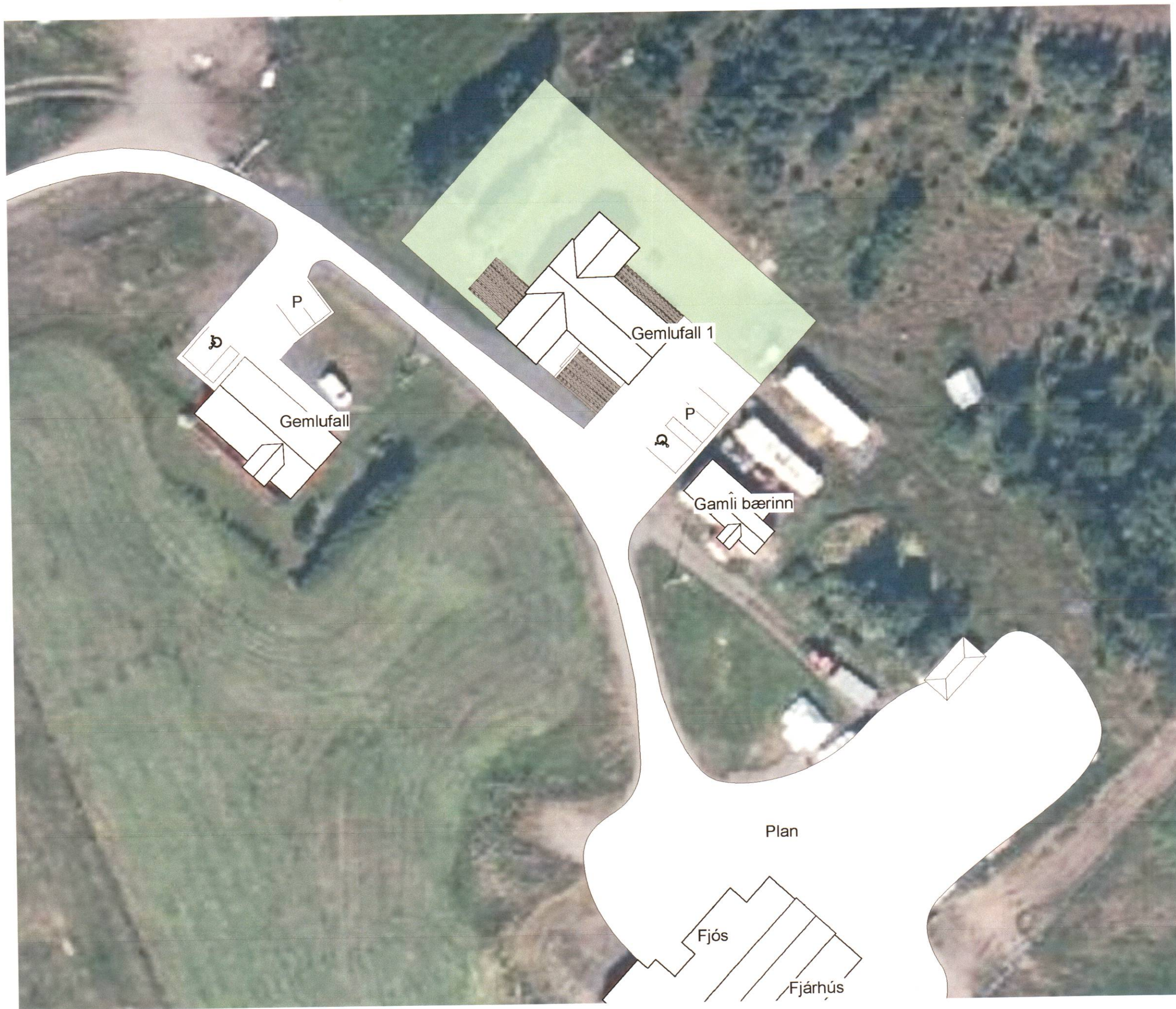
1 Afstöðumynd 1:500