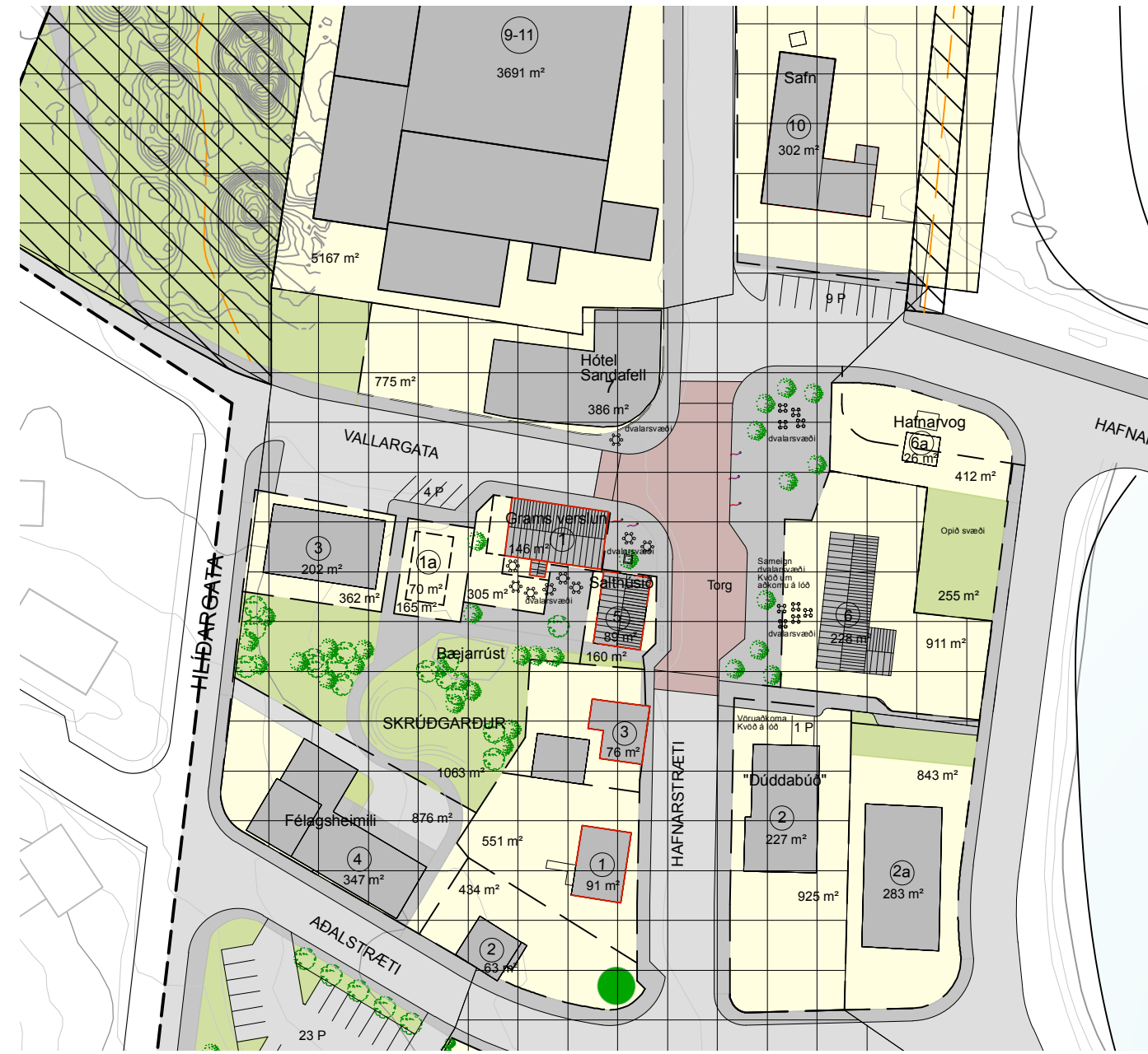
Afstaða - Deiliskipulagsbreyting Mkv. 1:1000