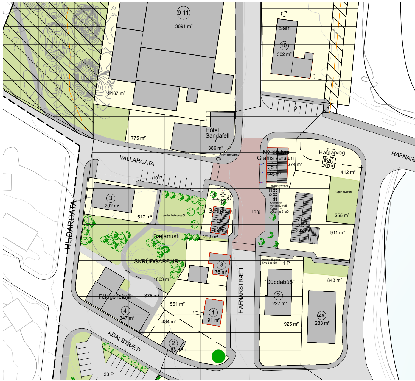
Afstaða - Hluti af gildandi deiliskipulagi Mkv. 1:1000