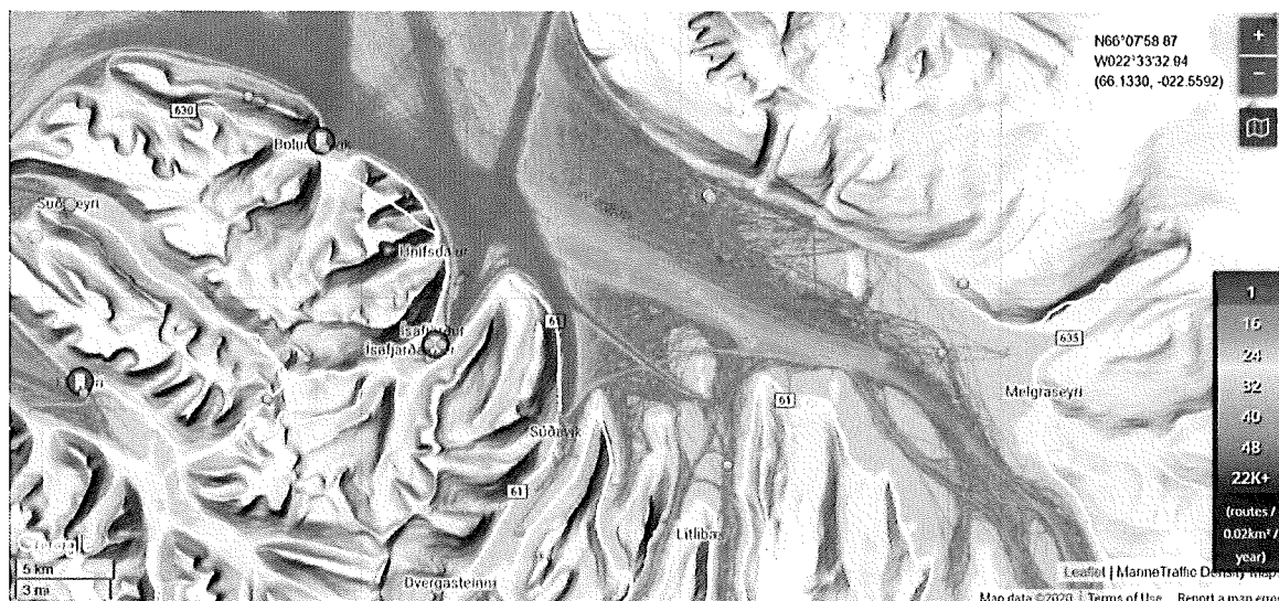
Mynd 2. Umferð báta og skipa í Ísafjarðardjúpi árin 2016 og 2017

Skiptingastofnun að áhrif eldisins á ferðamennsku og útivist komi til með að vera nokkuð neikvæð en afturkræf.