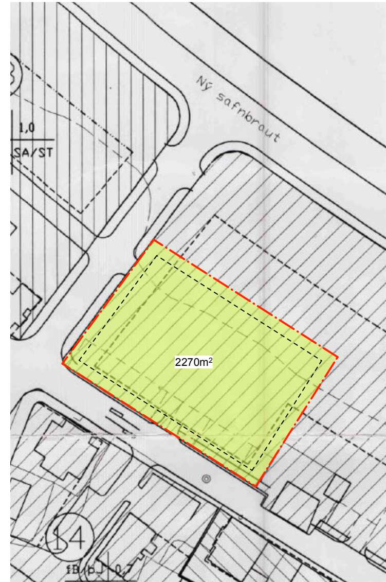
STÆKKUN LÓÐAR FJARÐARSTRÆTIS 20 1:1000