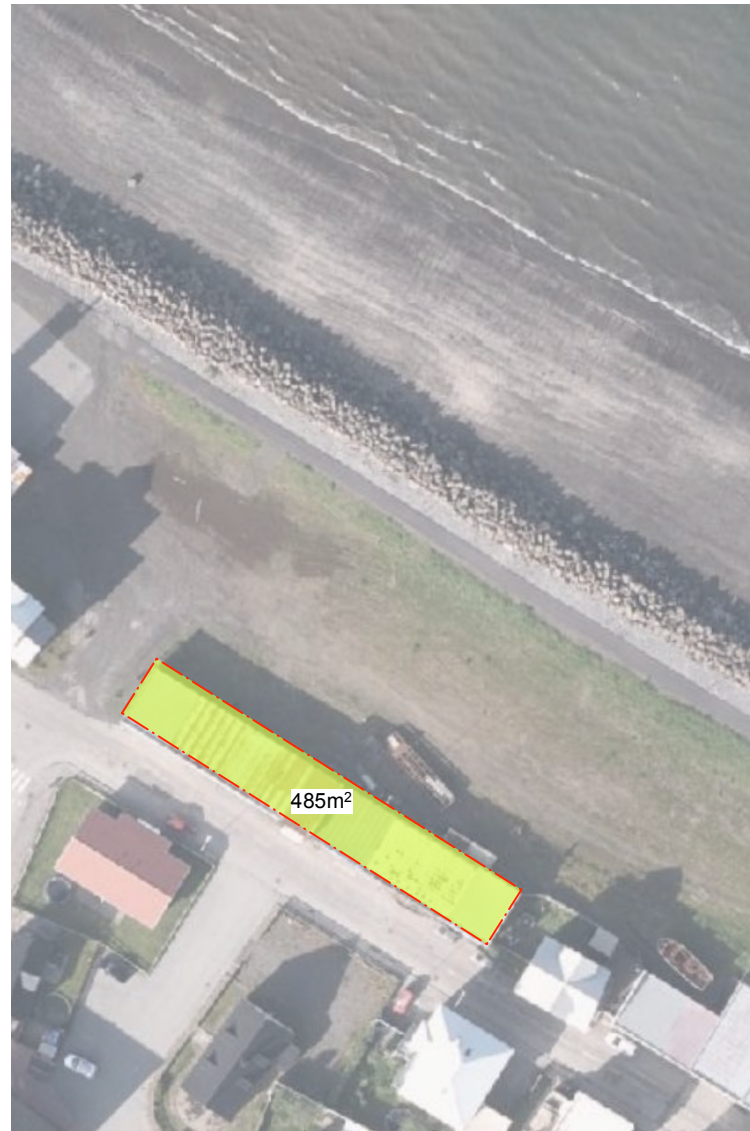
NÚVERANDI LÓÐ FJARÐARSTRÆTIS 20 1:1000