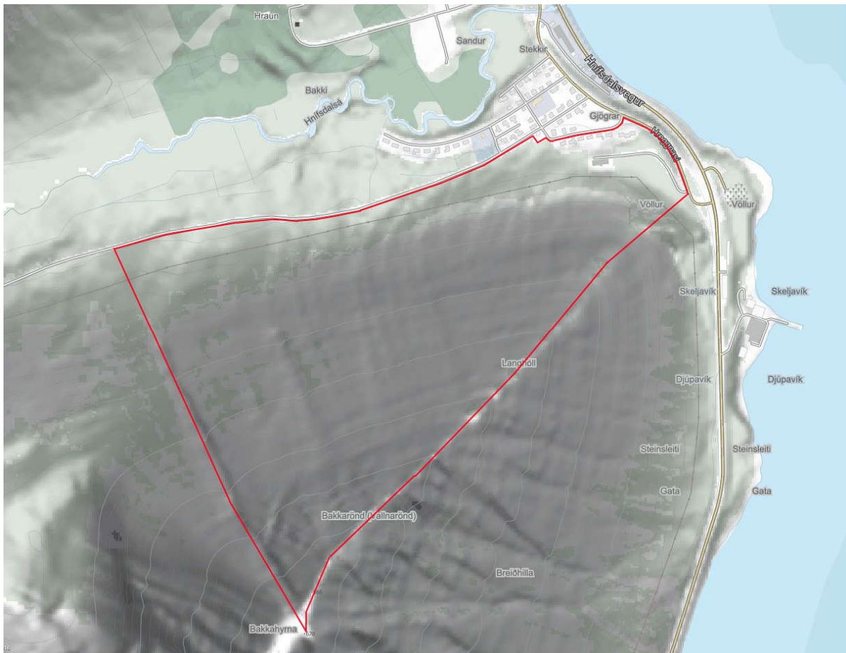
Mynd 3.1 Deiliskipulagssvæðið er sýnt með rauðri línu (Skipulagsvefsjá).

deiliskipulagssvæðisins sem tilheyrir þéttbýli Hnífsdals. Aðkoma að svæðinu liggur um Heiðarbraut, Dalbraut og Hreggnasa.